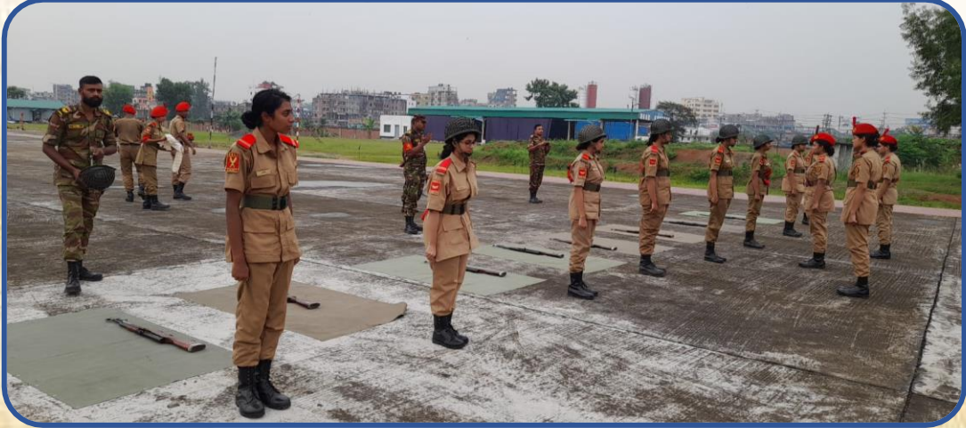
ক্যাম্পে ড্রিল সেশন।