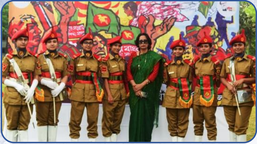
কলেজ প্রাপ্তনে স্বাধীনতার সুবর্ণজয়ন্তীর ৫০ বছর উদযাপন।