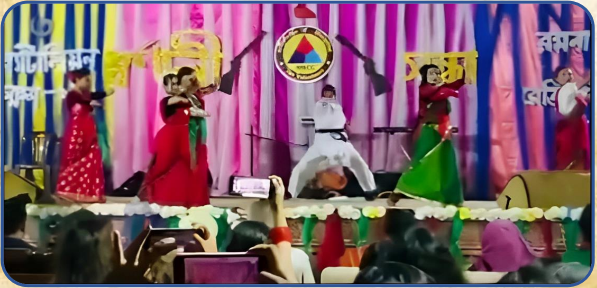
ব্যাটেলিয়ান-৩ ক্যাম্পে স্বর্ণালী সন্ধ্যায় শহিদ বীর উত্তম লে. আনোয়ার গার্লস কলেজের পরিবেশনা ।