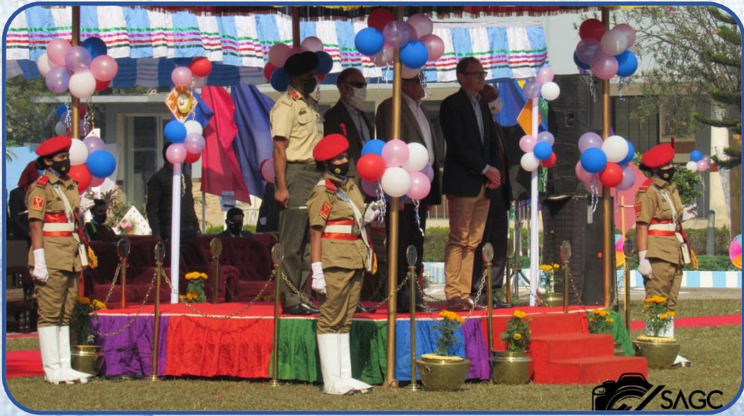
প্রধান অতিথি কুচকাওয়াজে সালাম গ্রহণ করছেন।