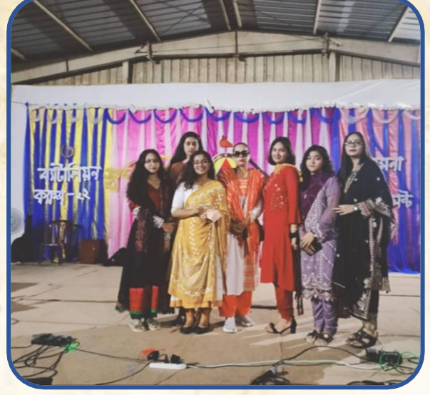
পাঁচ দিনব্যাপী ব্যাটেলিয়ান-৩ ক্যাম্প শেষে কোম্পানি কমান্ডারের সাথে ক্যাডেটদের ফটো সেশন ।