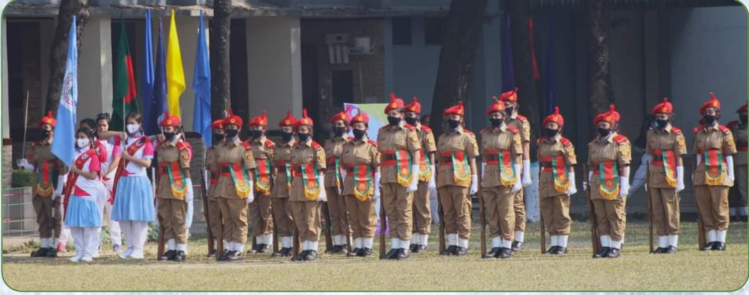
কুইনস ব্যাটন রিলে-২০২২-এ অংশগ্রহণকারী বিএনসিসি প্লাটুন