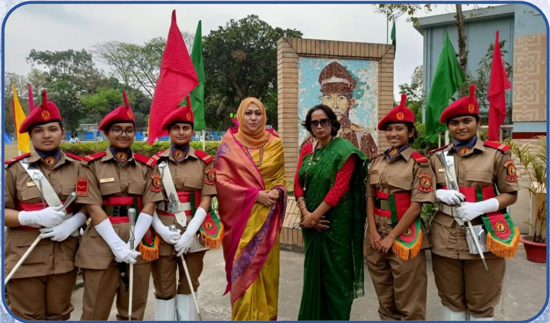
ক্যাডেটদের সাথে কোম্পানি কমান্ডারের এবং বিশেষ অতিথির ফটোসেশন ।