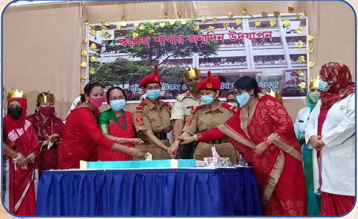
কলেজে শাখার ৩২ তম জন্মদিনে কলেজ অধ্যক্ষ শিক্ষক ও শিক্ষার্থীদের সাথে কেক কাটছেন ।