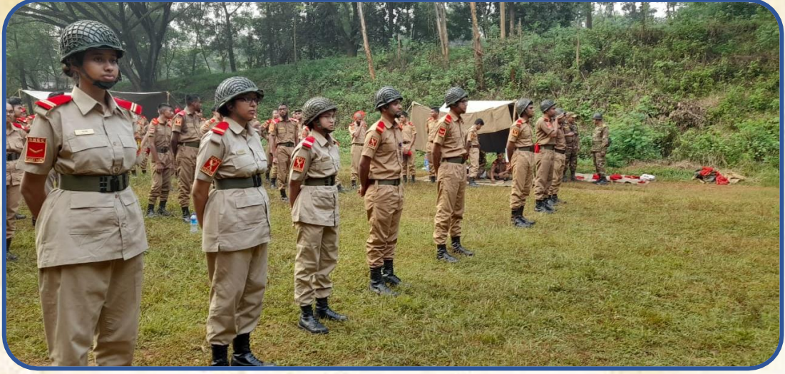
ক্যাডেটদের ব্যাটেলিয়ান-৩ ক্যাম্পে ফায়ারিং এ অংশগ্রহণ।