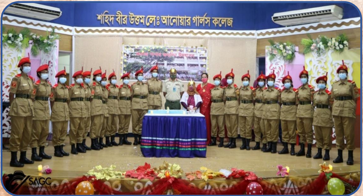
প্রোগ্রাম শেষে নতুন বিএনসিসি ক্যাডেটদের কলেজ অধ্যক্ষের সঙ্গে ফটোসেশন ।