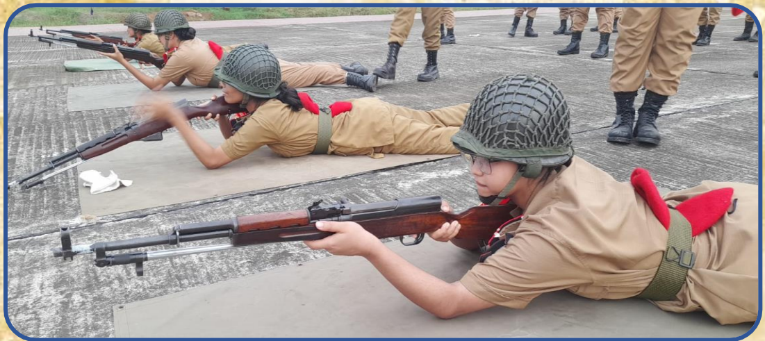
ক্যাম্পে ফায়ারিং এর জন্য প্রাক্টিস সেশন।