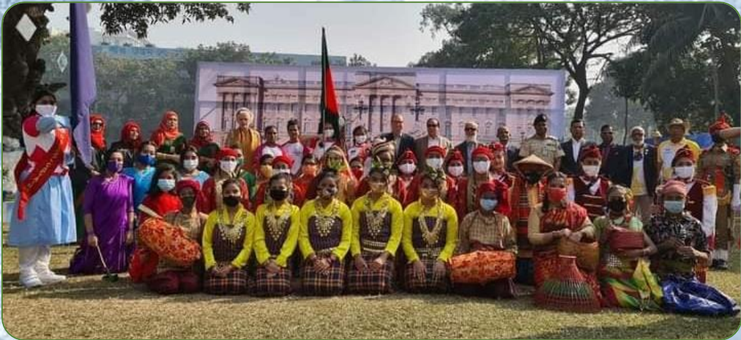
প্রোগ্রাম শেষে ইংল্যান্ডের হাইকমিশনের সাথে অংশগ্রহণকারীদের ফটোসেশন