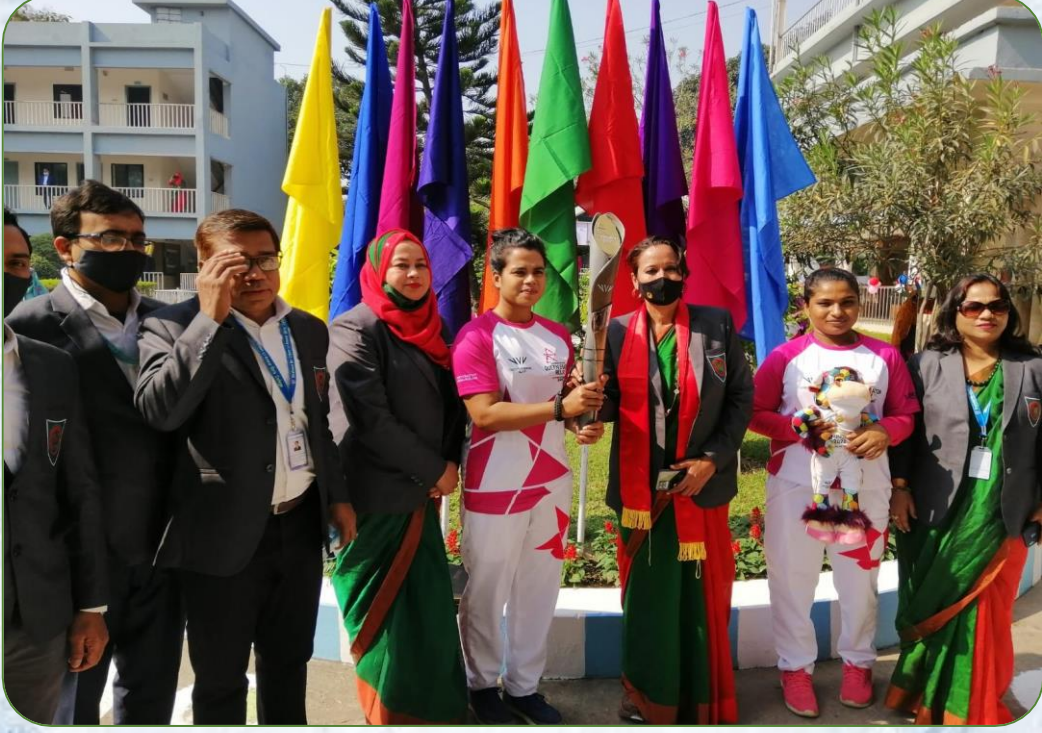
ব্যাটন হাতে বিএনসিসি কোম্পানী কমান্ডার